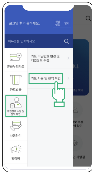
2 개인정보 수정 및 잔액확인 메뉴