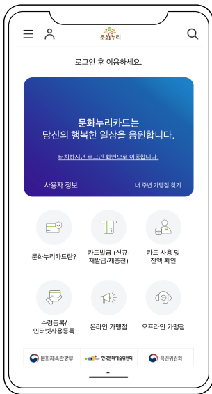
1 문화누리카드 모바일 앱 접속 및 로그인